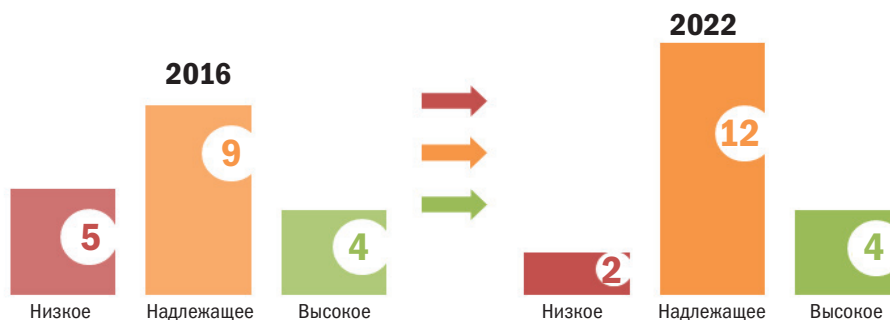
Рисунок 2. Изменение оценки качества управления муниципальными финансами

5 муниципальных образований повысили уровень качества управления муниципальными финансами на 1 уровень (с низкого до надлежащего)